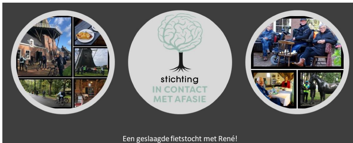
Een geslaagde fietstocht met René!

De donatie-pot is reeds aangesproken voor de eerste activiteit, een fietstocht die succesvol is verlopen!