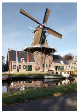
Standplaats molenmuseum de Wachter (Zuidlaren, Drenthe)

Aanmelding of meer informatie? Neem contact op middels het contactformulier of bezoek de website https://incontactmetafasie.nl/contactgroep/